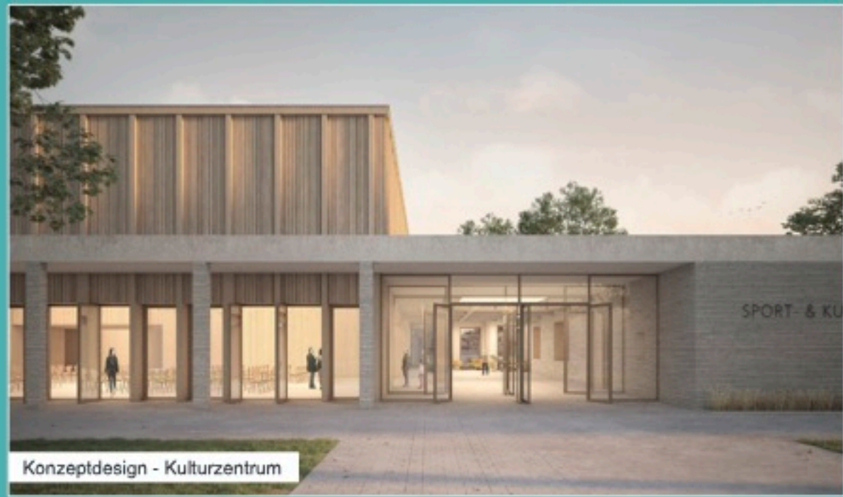
Konzeptdesign - Kulturzentrum