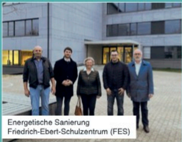
Energetische Sanierung Friedrich-Ebert-Schulzentrum (FES)