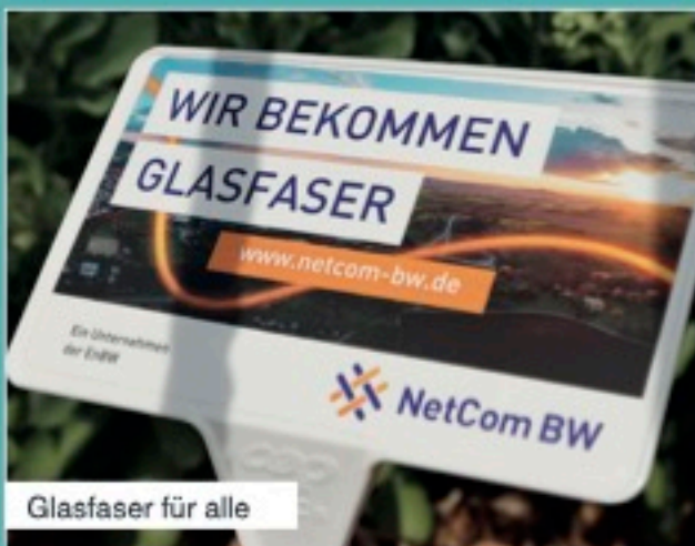
Glasfaser für alle